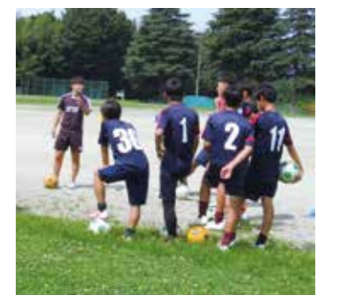
佐野市の中学校部活動地域クラブ化実証事業を積極的に推進しています。